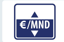
Voorspelbare kosten per maand