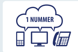
Overal bereikbaar op één nummer