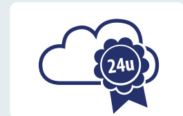
Betrouwbaar via de cloud