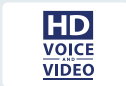
HD audio en video