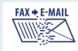
Fax naar e-mail