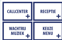
On Demand functies