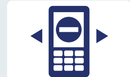
Bepaal overal je bereikbaarheid