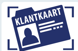
Integratie met CRM & ERP