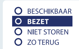
Beschikbaarheid collega's inzichtelijk